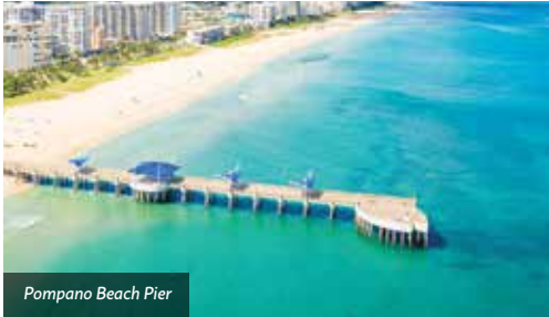
Pompano Beach Pier

Acht von 31 Gemeinden liegen direkt am Atlantik, sechs davon erhielten ein Zertifikat für ihre vielfach empfohlenen Blue Wave Strände. Viele Orte, die im Inland liegen, sind auch über Wasserwege gut erreichbar.