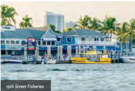
15th Street Fisheries