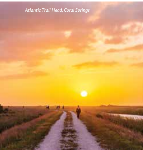
Atlantic Trail Head, Coral Springs