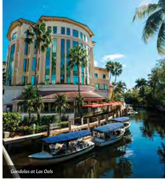
Gondolas at Las Oals

ZWEITER TAG: Für das Frühstück empfiehlt sich das Old Fort Lauderdale Breakfast House am Las Olas Boulevard oder The Alchemist in Wilton Manors, die beide von The New Times als die besten Coffee Shops der USA gewürdigt wurden.