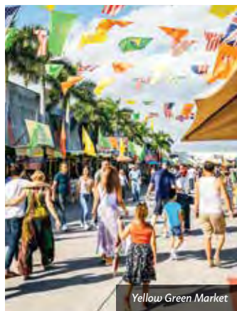
Yellow Green Market

finden Sie den größten Hallen- und Freiluft-Flohmarkt der USA? Bekannt als Swap Shop umfasst er eine Fläche von 360.000 Quadratmetern und ist 365 Tage im Jahr geöffnet. Hier wird eine erstaunliche Auswahl an ungewöhnlichen und wunderbaren Dingen zum Kauf angeboten. Dazu gehört aber auch ein kostenlos zu besichtigendes Ferrari Museum, eine Video-Spielhalle und Fahrgeschäfte wie auf dem Jahrmarkt. Außerdem verwandelt sich Swap Shop jede Nacht in das größte Autokino der Welt.