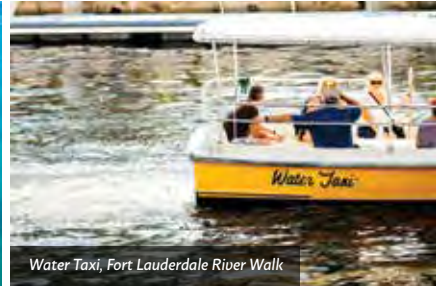
Water Taxi, Fort Lauderdale River Walk

Als nächstes folgen der ruhige Lighthouse Point und Pompano Beach . Hier ist das Wasser wegen der Nähe zum Golfstrom mit am wärmsten und klarsten im Süden Floridas und daher sowohl bei Schwimmern als auch Fischern beliebt. Außerdem hat man hier Zugang zum in den USA einzigartigen, direkt vom Strand aus