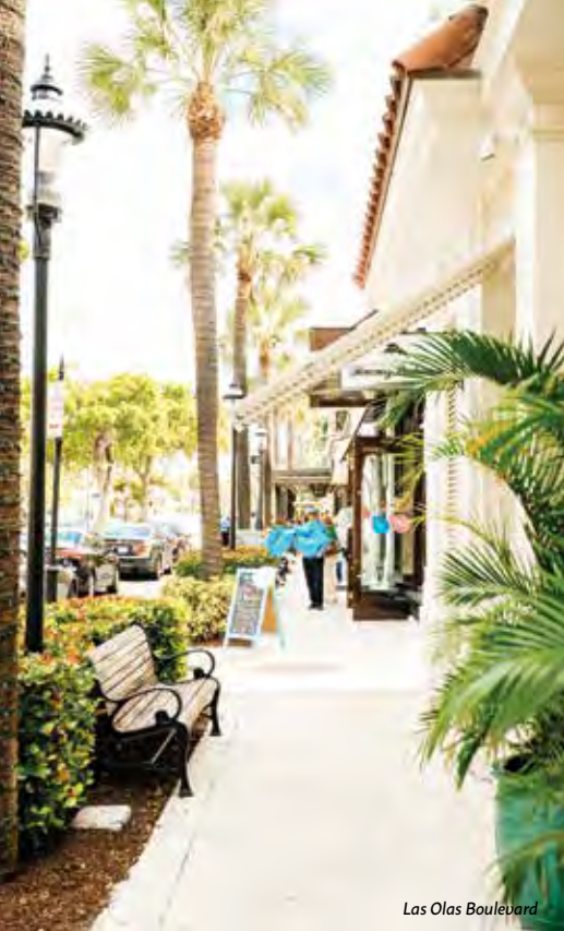
Las Olas Boulevard

an Restaurants und einer Plaza mit Springbrunnen. Für jeden sehr gut erreichbar ist die Westfield Broward Mall in Plantation, da hier alle Geschäfte auf einer Etage liegen und es kostenlose Rollstühle und spezielle Parkplätze gibt. Dania Pointe bietet den Gästen nicht nur großartige Einkaufsmöglichkeiten plus Restaurants und Hotels, sondern es liegt sehr bequem direkt am Flughafen am Interstate-Highway 195.