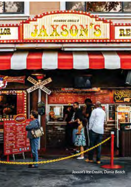
Jaxson's Ice Cream, Dania Beach

ERKUNDEN SIE DIESE INSTAGRAM- TAUGLICHEN ORTE