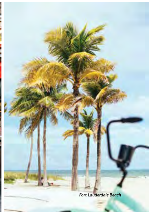
Fort Lauderdale Beach