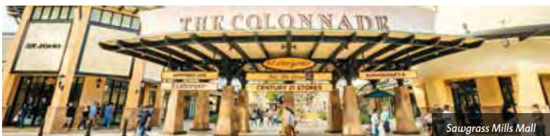
Sawgrass Mills Mall

Eine weitere Möglichkeit in Pembroke Pines ist The Shops at Pembroke Gardens , eine elegante Open-Air-Mall mit Geschäften bekannter Modemarken, einem breiten Angebot